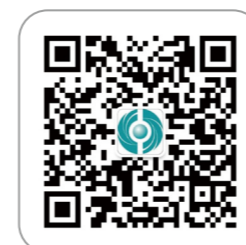
中国技术交易所微信公众号

中国技术交易所（北京知识产权交易中心）、北京软件和信息服务业交易所积极开展科技成果转化、技术交易、科技金融等专业服务，助力北京国际科技创新中心和创新型国家建设，推动创新驱动发展战略深入实施。