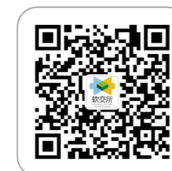
北京软件和信息服务业交易所 微信公众号