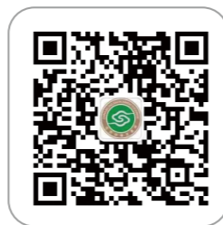
北京绿色交易所微信公众号