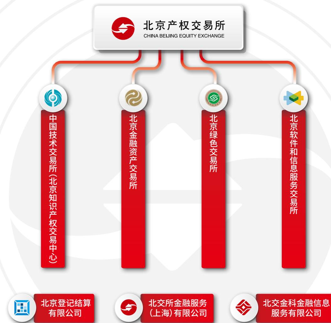
北交所设立的主要交易平台和支撑服务机构